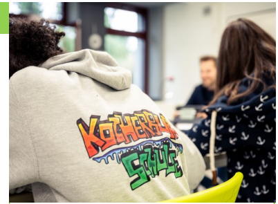
10. Klässlerinnen beteiligen sich an der Gedenkaktion zur Widerstandsbewegung „Weiße Rose“ in Aalen